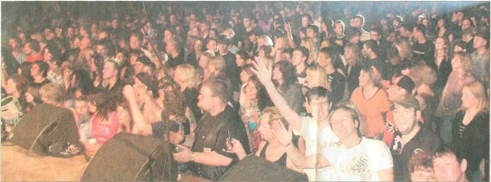
Die Festhalle tobte: Mit diesem Rock-Spektakel erwiesen die Motorradfreunde eine guten Riecher. Mehrere Hundert fanden Samstagabend den Weg in die Drachenstich-Festhalle.