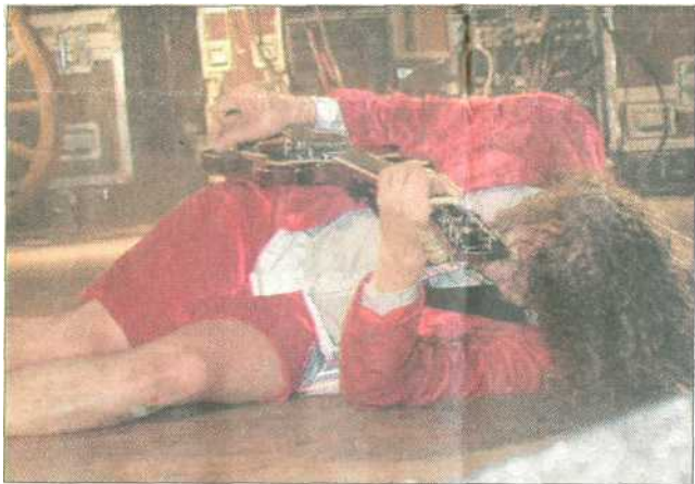
zur Ekstase: Bei ihrer Bühnen-Show schenken sich die Musiker nichts.