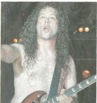
Kaum jemand dachte mehr daran, dass nicht wirklich AC/DC auf der Bühne steht. Dafür sorgte nicht nur die Leidenschaft der Musiker...

Ein großes Lob gilt an dieser Stelle auch dem Veranstalter, den Further Motorradfreunden. Sie hatten alles bestens organisiert und so verlief die Rocknacht in der Further Festhalle absolut hervorragend.