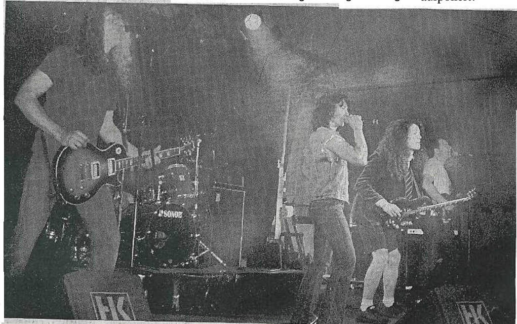
Bei dem knallharten, aber ehrlichen Sound der ACDC Revival Band kochte die Stimmung.

Harter Schlagzeug wäre das Ganze eben nur etwas „Halbes“ gewesen. Natürlich gab es die gesamte Palette der AC/DC-Songs zu hören, von den „Klassikern“ bis zu den neuesten Titeln dieser Kultband. Die Neunburger Formation „Burner“ meisterte ihren Part, als „Anheizer“ im ersten Konzertabschnitt bravurös. Die Entscheidung der Veranstalter, eine so namhafte Band aufzubieten hat sich gelohnt, das Image der „Messestadt“ wurde durch diesen Live-Act weiter aufgepoliert!